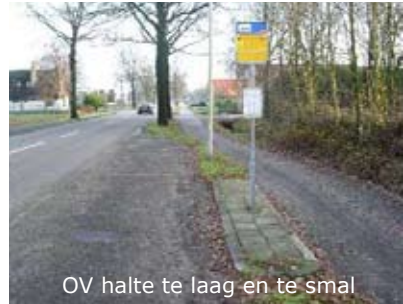
OV halte te laag en te smal

plassen: ho maar.' Wat ongeduldig liep Smits door, tastend met haar stok op zoek naar gras, in de hoop dat Uschi daar wel zou plassen. Maar waar bleef nu het groenstrookje waarop ze haar hond vaker uitlaat? In plaats van gras voelde Smits aangestampt zand en een reep beton. Daarachter zou vast de afstap naar het gras zijn. Ze stapte over de betonnen rand en daar was... niets. Plons. (bron: AD.nl)