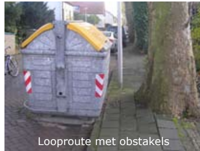
Looproute met obstakels