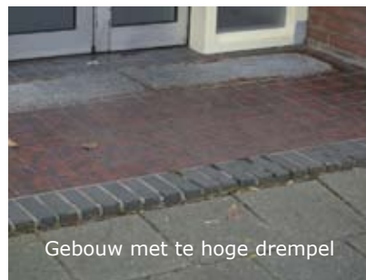
Gebouw met te hoge drempel